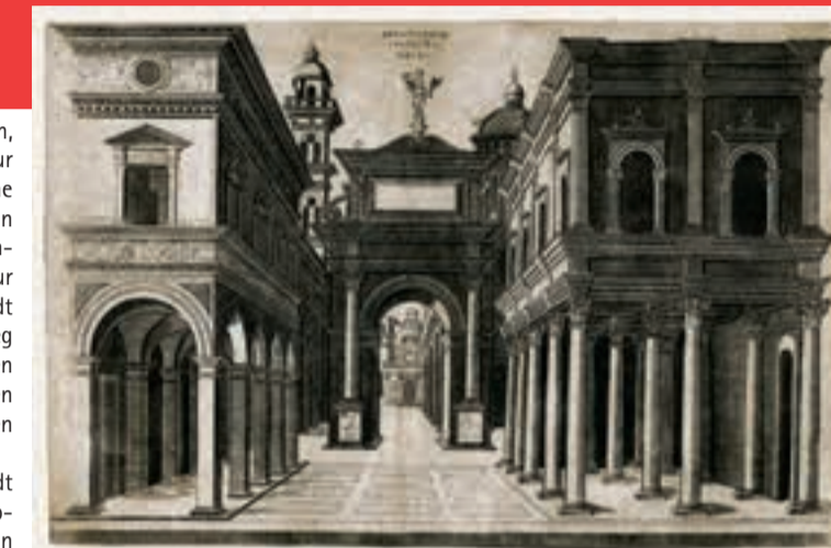
Donato Bramante (?) Strassenzug flankiert von Gebäuden, Kolonnaden und Torbogen (Bühnenbild), um 1490 Kupferstich / 24,4 x 36,7 cm ETH Zürich, Graphische Sammlung