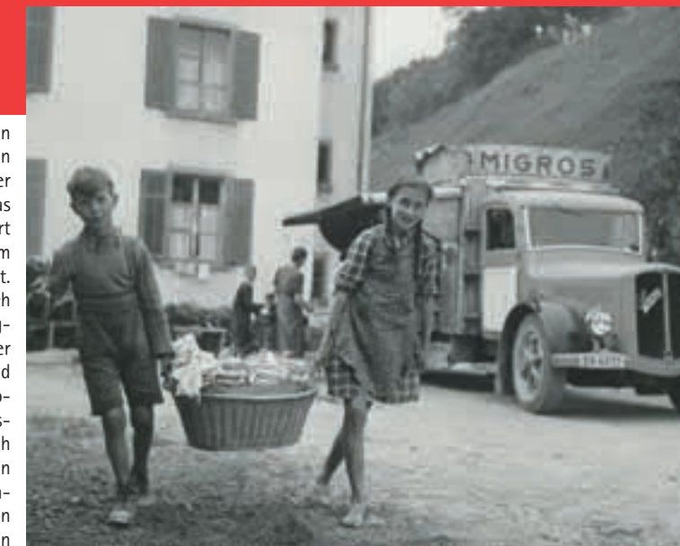
Theo Frey: Migroswagen in Arbeitersiedlung Tössal, Gelatinesilber-Abzug, 1942. Schweizerische Landesmuseen, Sammlung Herzog © Fotostiftung Schweiz

Mit der Wechselausstellung «Aufbruch in die Gegenwart. Die Schweiz in Fotografien 1840–1960» wird aus dem wertvollen Fundus an historischen Fotografien der Schweizerischen Landesmuseen eine Geschichte der Schweiz erzählt, die eine prägende Zeitspanne umfasst sowohl für das Land als auch für das Medium Fotografie. Die Ausstellung dokumentiert die eindrückliche Entwicklung von einer wild-romantischen Schweiz zum Agrarstaat bis hin zum modernen Industrie- und Dienstleistungsstaat. Aussagekräftige Fotografien zeugen vom Bedürfnis der Schweiz nach Identifikationsfiguren. Gerade das Medium Fotografie hat durch die Möglichkeiten seiner Verbreitung zum grossen Bekanntheitsgrad einzelner Personen beigetragen. Dank der Tätigkeit professioneller Fotografen und Amateurfotografen, den so genannten Knipsen, ist das Wachsen der modernen Schweiz für BesucherInnen sicht- und nachvollziehbar. Die Ausstellung entstand in Zusammenarbeit mit Ruth und Peter Herzog, die nach 1994 im Jahre 2008 den zweiten Teil ihrer umfassenden Sammlung an Schweizer Fotografien den Schweizerischen Landesmuseen offeriert haben. Die Begleitpublikation «Aufbruch in die Gegenwart. Die Schweiz in Fotografien 1840–1960» erscheint im Limmat Verlag, herausgegeben von Dieter Bachmann und den Schweizerischen Landesmuseen. Erhältlich ist sie sowohl im Museumshop des Landesmuseums Zürich als auch im Buchhandel (ISBN 978-3-85791-593-2).