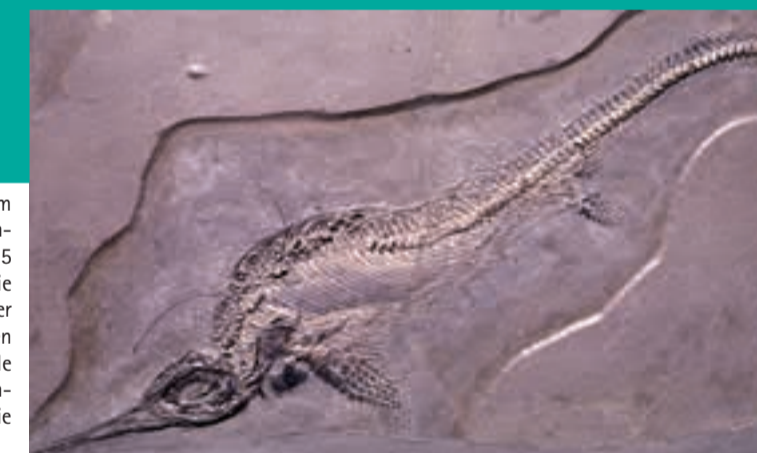
Fischsaurier (Mixosaurus cornalianus) aus der Mitteltrias des Monte San Giorgio, dem UNESCO-Weltnaturerbe im Südtessin

Saurier und Fische aus der Mitteltrias des Monte San Giorgio, dem UNESCO-Weltnaturerbe im Südtessin, bilden den Schwerpunkt der permanenten Ausstellung des Universitätsmuseums für Paläontologie. Mit den 235 bis 245 Millionen Jahre alten Fossilien verfügt die Universität Zürich über die wichtigste Referenzsammlung der beiden Wirbeltiergruppen. Sie dient der eigenen und internationalen Evolutionsforschung insbesondere auch für den Vergleich mit den neuen, etwa gleichaltrigen Funden aus Südkina. Viele weitere Fossilien aus der Umgebung von Zürich, aus den Alpen, den benachbarten Ländern Europas und aus Nordamerika geben zudem Einblick in die veränderte Tierwelt der jüngeren Erdgeschichte. Seit einigen Jahren untersucht ein Forschungsteam des Paläontologischen Instituts und Museums die Erholung der Organismen kurz nach dem grössten Massenaussterben der Erdgeschichte an der Perm/Trias-Grenze. Dieses Projekt gab den Anstoss zur neuen Sonderausstellung «Massenaussterben und Evolution – Katastrophen als Verhängnis und Chance für Lebewesen seit Milliarden von Jahren». Ein reichhaltiges Begleitprogramm bietet Gelegenheiten, mit den Forschern zu diskutieren. Im gleichzeitig erschienenen und im Museum erhältlichen Buch «Massenaussterben und Evolution» vertiefen die fünf Paläontologen und Ausstellungsautoren das spannende Thema.