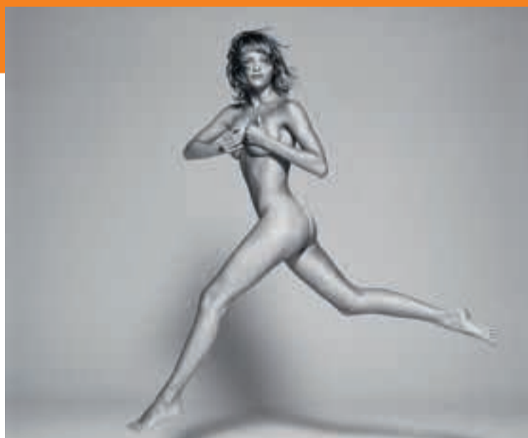
Helena Christensen, Vogue Italia, 1993