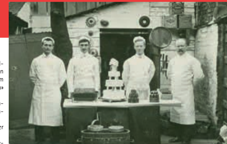
Die Bündler Zuckerbäcker wussten, wie man eine Geburtstagsorte bäckt ... Pasticceria Lardi, Southampton

Detailliertes Programm unter www.johann-jacobs-museum.ch