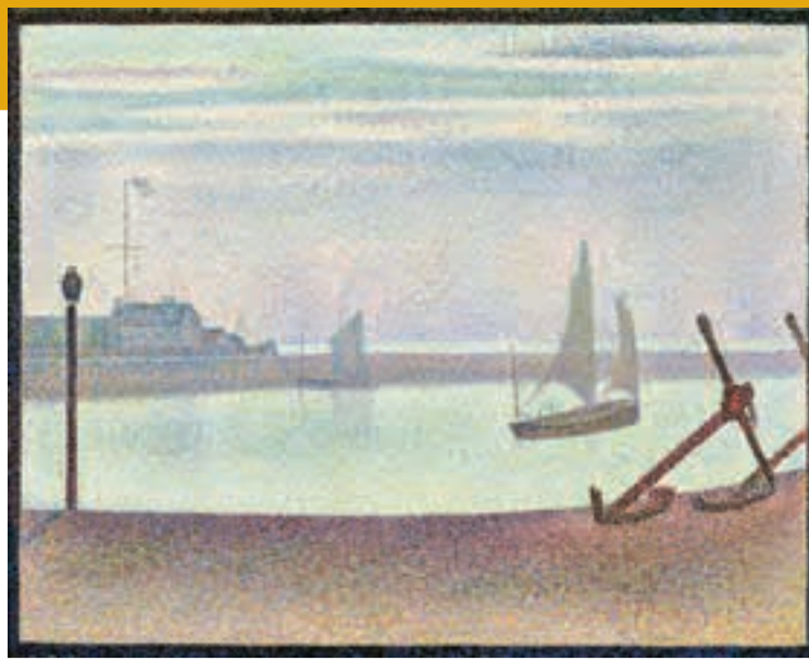
Georges Seurat Le Chenal de Gravelines: Un Soir, 1890 The Museum of Modern Art, New York

Under the heading «Figure in Space», the Kunsthaus Zürich presents work by one of the fathers of modern art, Georges Seurat until 17 January 2010. As a colleague of Paul Cézanne and Vincent van Gogh, Seurat brought a scientific precision to bear on impressionist painting. Where there was nothing but light and atmosphere he introduced rational dialogues between figures and the space surrounding them, as attested by the over 70 high-quality paintings and drawings the Kunsthaus Zürich has assembled from important public and private collections in London, Paris, New York and Washington.