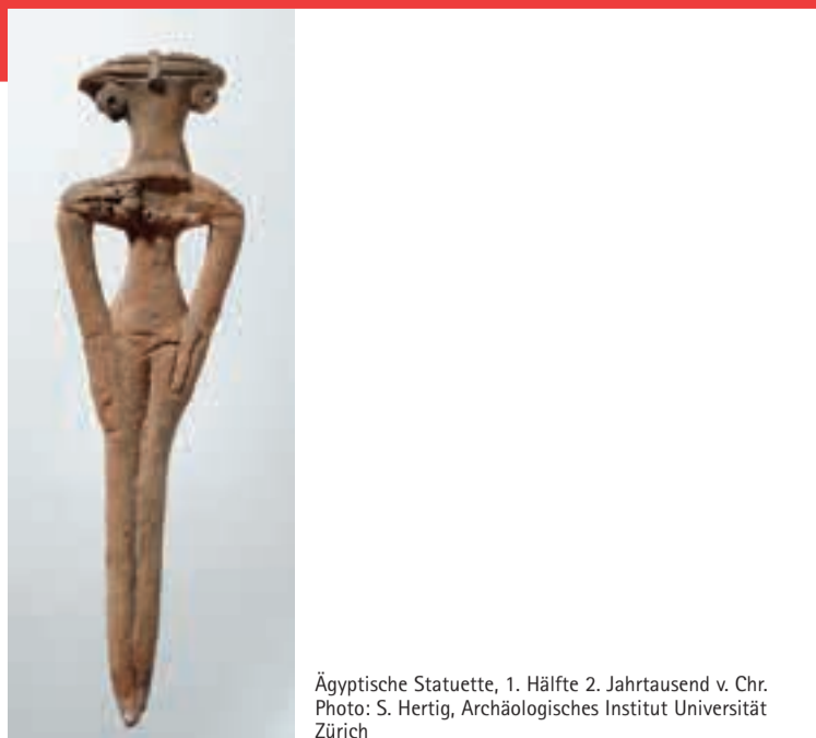
Ägyptische Statuette, 1. Hälfte 2. Jahrtausend v. Chr.

Die ständige Ausstellung der Archäologischen Sammlung wurde, bereichert durch verschiedene Schenkungen, neu eingerichtet und neu konzipiert. Der Schwerpunkt liegt auf dem Nebeneinander von Objekten unterschiedlicher, aber gleichzeitiger antiker Kulturen des 3. bis 1. Jahrtausends v. Chr. Dadurch wird für den Museumsbesucher die dynamische, sich gegenseitig beeinflussende Entwicklung verschiedener antiker Kulturen erfahrbar.