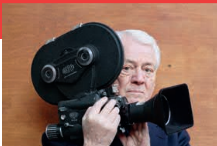
Alexander Kluge, 14.3.2006, München

Die Ausstellung «Dichter am Apparat» rekonstruiert diese Begegnungen, von Alfred Döblin, Bertolt Brecht und Walter Benjamin über Günter Eich, Peter Weiss, Ernst Jandl, Friederike Mayröcker, Peter Handke, Hans Magnus Enzensberger und Alexander Kluge bis zu den neuen Internetpoeten. Sie verzichtet auf Originalexponate zugunsten einer multimedialen und interaktiven Präsentation, so dass die Besucherinnen und Besucher in Hörspiele hineinhorchen, in Filme hineinsehen und mit Computeranimationen spielen können.