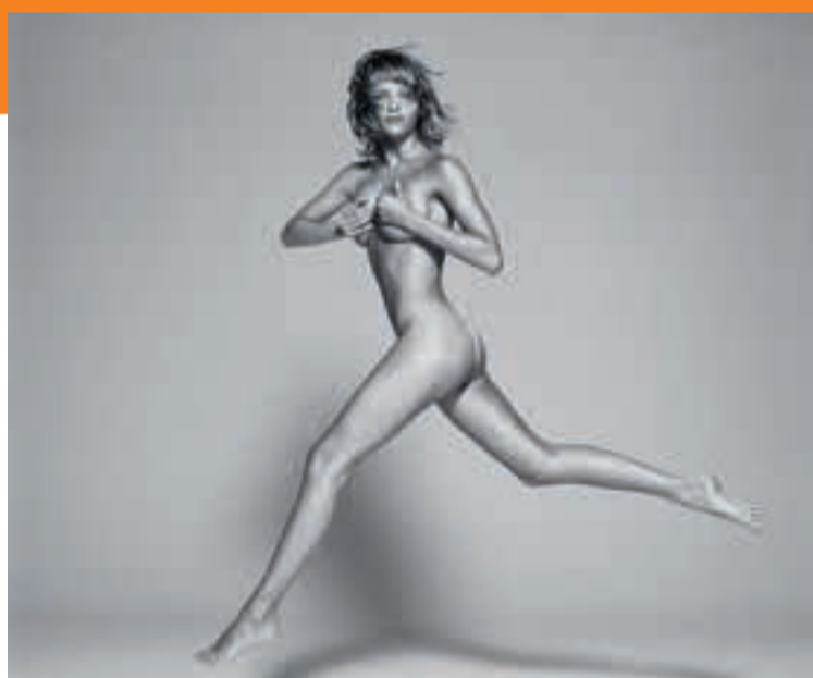
Helena Christensen, Vogue Italia, 1993