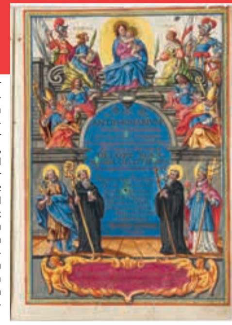
2. Antiphonar, um 1670. Titelbild mit Maria und Heiligen. Ms. Rh. hist. 164, f. IIIr. Zentralbibliothek Zürich

1864 wurde die Bibliothek des Klosters Rheinau aufgelöst und ein grosser Teil der Hand- und Druckschriften in die Zürcher Kantonsbibliothek überführt. Manche Schätze werden nun erstmals einem breiteren Publikum gezeigt. Das Schwergewicht liegt auf den Beständen des 15. bis 19. Jahrhunderts. Zu den Preziosen gehören die rund 300 Druckschriften, die vor 1500 erschienen sind und aus der Anfangszeit des Buchdrucks stammen, sog. Inkunabeln. Unikate und ästhetisch ansprechende Buchmalereien sind zu sehen. Unter den frühneuzeitlichen Titeln treten die historischen Fächer in den Vordergrund. Die Mönche widmeten sich Philosophie, Theologie und Kirchenrecht, aber vor allem der Kirchen-, Kloster-, Adels-, Lokal- und Schweizer Geschichte, der Hagiographie, Genealogie, Heraldik, Numismatik und Naturwissenschaften. Die Ausstellung vermittelt erstmals Einblicke in das klösterliche Schulleben. Eine weitere Premiere stellt die Präsentation verschollener Musikfragmente aus Rheinau dar, die während der Restauration der Orgel (1988 bis 1991) ans Licht gekommen sind. Ansichten spüren der verschiedenartigen bildlichen Darstellung des Klosters seit dem 16. Jahrhundert nach, und die Güterpläne des 18. Jahrhunderts lassen Rückschlüsse auf die landwirtschaftliche Nutzung und die Besitzverhältnisse innerhalb des damaligen Rheinauer Banns ziehen.