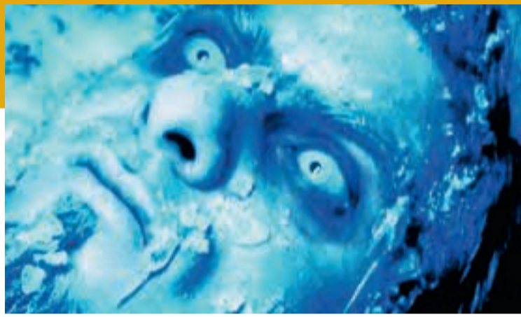
Videoart: The Iberoamerican Legend, 2002