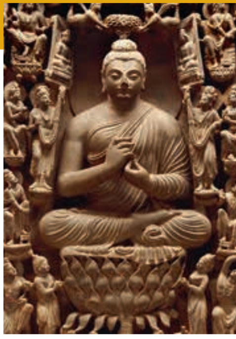
Buddha-Paradies Mohammed Nari, 4. Jahrhundert n. Chr. Schiefer Museum Lahore, Lahore

Gandhara was once the intersection of several important trade routes. Along these trails a lively cultural exchange took place: Western antique culture met Buddhism from India, and nomadic peoples from Central Asia. All these different influences merged into a unique Buddhist culture. In 2001 the monumental statues of the Buddha at Bamiyan in Afghanistan – once proud witnesses of Gandhara culture – were dynamited and destroyed. But this exhibition shows another side of this region: Gandhara's past is full of riches, tolerance and cultural diversity.