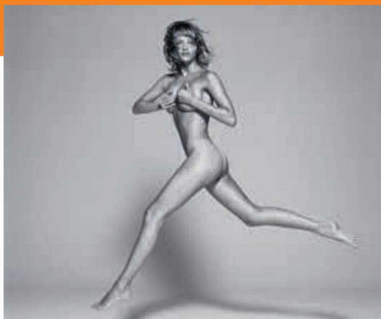
Helena Christensen, Vogue Italia, 1993