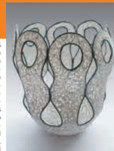
(Wesen) Ilaria Ghezzi, Wesen IV, Porzellan, 2008; Ilaria Ghezzi, Zürich, Photo: © Ilaria Ghezzi

Weitere Informationen sowie Rahmenprogramm: www.museum-bellerive.ch