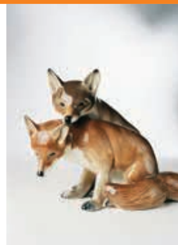
Füchse Waldemar Lindström, Porzellanmanufaktur Rörstrand, 1910, zwei Füchse, Porzellan, 1956, Rörstrand-Museum, Lidköping, Photo: Patrik Johansson © Rörstrand Museum