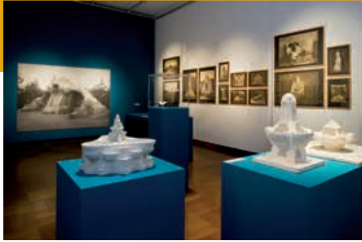
MB-001 Museum Bellerive, Ausstellungsansicht: Hermann Obrist – Skulptur | Raum | Abstraktion um 1900

Weitere Informationen sowie Rahmenprogramm: www.museum-bellerive.ch