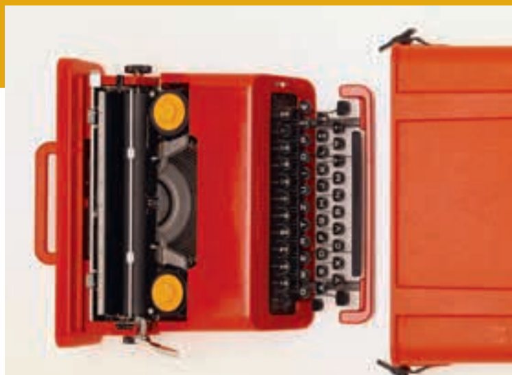
Perry King, Ettore Sottsass, Valentine S. Schreibmaschine, Olivetti Spa, Italien, 1969, Designsammlung, Museum für Gestaltung Zürich

Is everything design today? The Museum für Gestaltung Zürich is looking into this question with the presentation of its internationally important collections (poster, design, applied art, graphics), which has never been previously exhibited to this extent. The overriding theme is the observation of processes of social and cultural change. Social codes and norms determine what is regarded as modern and fashionable at what time. A variety of visual and content-related input on the theme enables the question of changing values to be examined. www.museum-gestaltung.ch