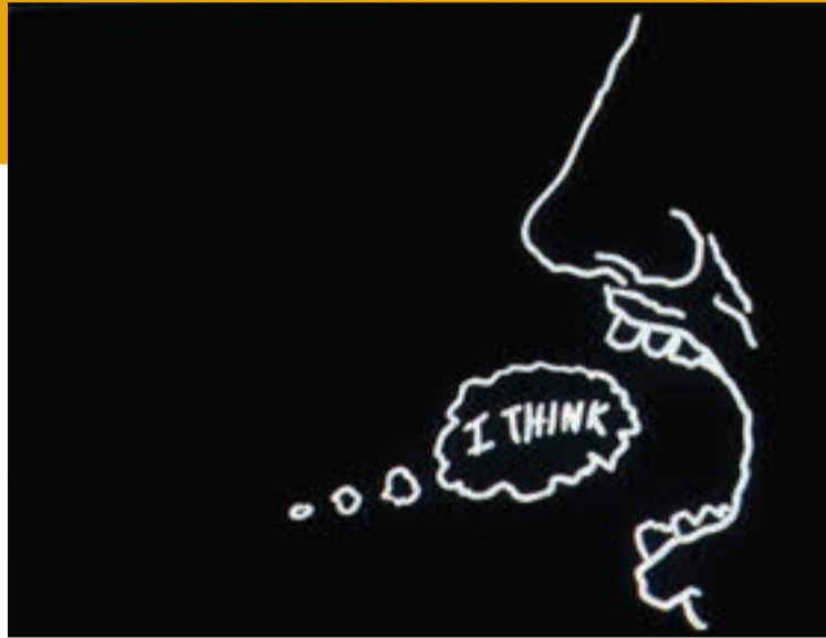
Lázaro Saavedra Yo pienso (I Think), 2005, Animation, 4:54 min, b/w, sound Daros Latinamerica Collection, Zürich