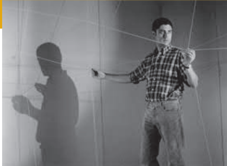
Gianni Colombo in seinem Ambiente «Spazi elastico», trigon 67, Graz 1967

Gianni Colombo (1937–1993) is among the most impressive representatives of Op Art and Kinetic Art. His «Ambienti», which create spatial arrangements with artificial light and changeable structures, began to appear in 1964. Colombo also called them «Spazi elastici», elastic spaces: elastic bands are moved horizontally and vertically either by hand or by motors and as a result the spatial constellations change continuously. The exhibition at Haus Konstruktiv is the first comprehensive retrospective in a Swiss museum dedicated to the artist. At the same time Sehgal realises one of his distinctive projects.