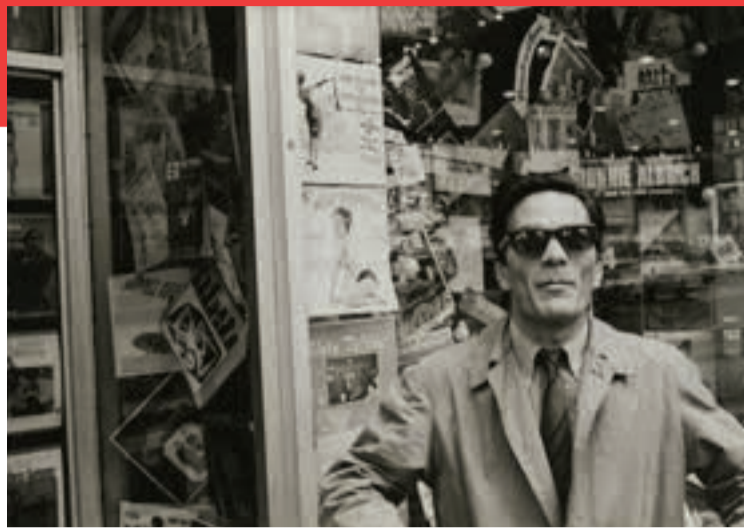
Pier Paolo Pasolini in New York, 1966

Pier Paolo Pasolini (1922–1975) ist eine der herausragendsten und schillerndsten Persönlichkeiten des intellektuellen Europas in der 2. Hälfte des 20. Jahrhunderts. Als Lyriker in der Sprache seiner friaulischen Heimat, als Autor von Romanen und kulturkritisch-politischen Essays und Kolumnen, als Regisseur polarisierender Filme, aber auch als Zeichner und Maler richtete sich sein Blick in erster Linie auf zeitlose, archaische Themen: das Schicksal des Menschen, das bäuerliche Leben, die Religion, die Sexualität, der Tod. Dabei bewegte er sich stets ausserhalb gängiger Normen und wurde zum grössten Provokateur der italienischen Gesellschaft. Sein gewaltsamer, noch immer nicht restlos geklärt Tod, den er in seinem Werk zum Teil vorweggenommen hat, war ein Schock, den die italienische Öffentlichkeit bis heute nicht verwunden hat. In der Multi- und Transmedialität seines Werkes erscheint Pasolini als äusserst unbequemer, streitbarer, aber auch verletzlicher Künstler, der provozierte und polarisierte.