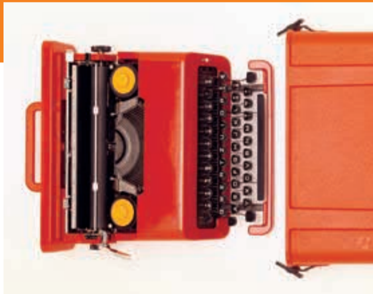
Perry King, Ettore Sottsass, Valentine S, Schreiber, 1969, Olivetti Spa, Italien, 1969, Designsammlung, Museum für Gestaltung Zürich

Is everything design today? The Museum für Gestaltung Zürich is looking into this question with the presentation of its internationally important collections (Poster, Design, Applied Art, Graphics), which has never been previously exhibited to this extent. The overriding theme is the observation of processes of social and cultural change. Social codes and norms determine what is regarded as modern and fashionable at what time. A variety of visual and content-related input on the theme enables the question of changing values to be examined. www.museum-gestaltung.ch