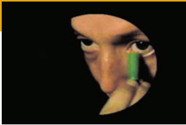
Ximena Cuevas El diablo en la piel, 1998 Single channel video 5:00 min, color, sound Daros-Latinamerica Collection, Zürich Photo: Zoé Tempest, Zürich © the artist